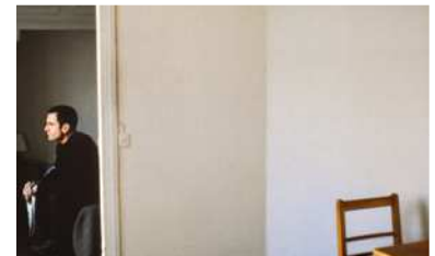
Les Jours où je n'existe pas de Jean-Charles Fitoussi, 2002