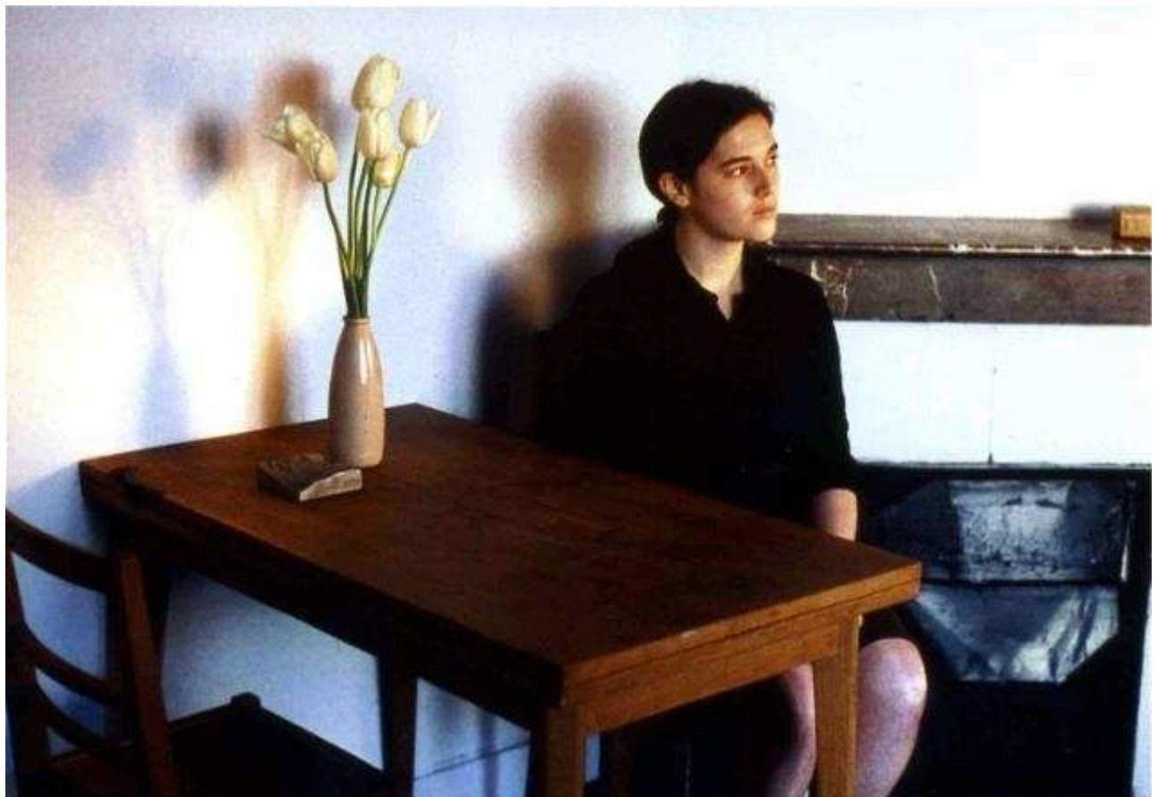
Les Jours où je n'existe pas de Jean-Charles Fitoussi, 2001