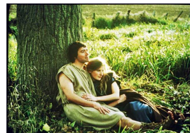
Le dieu saturne de Jean-Charles Fitoussi, 2003

Film suivi de Bienvenue dans l'éternité de Jean-Charles Fitoussi