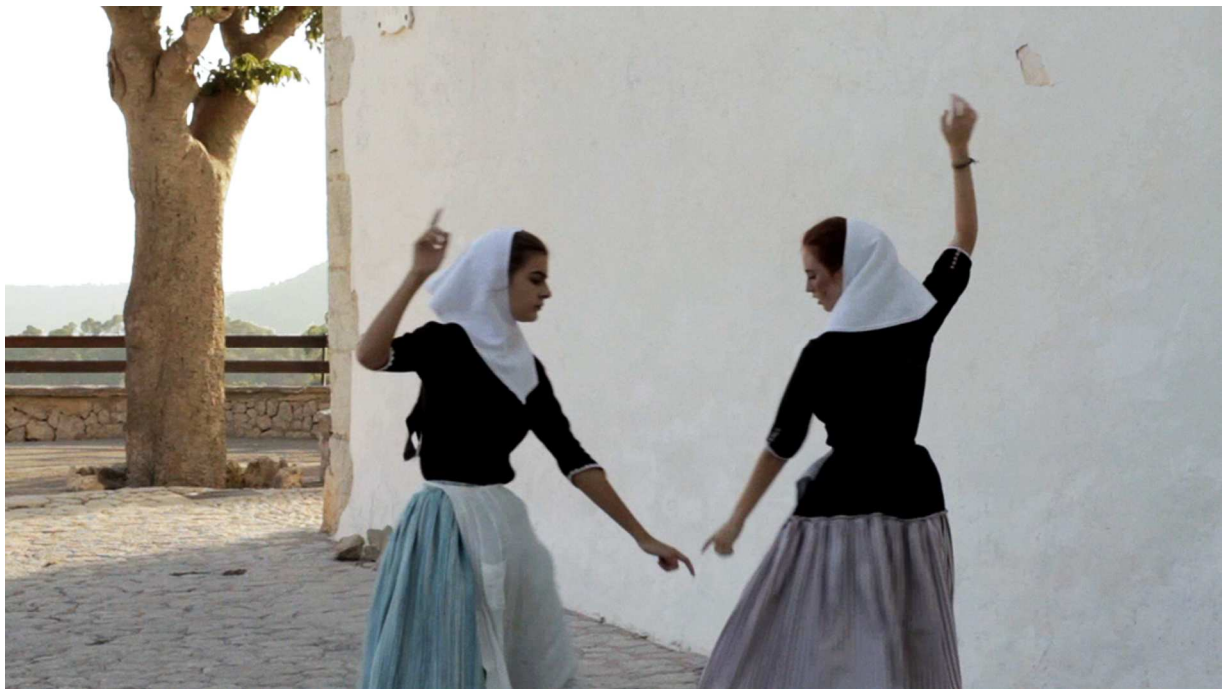
De la musique ou la Jota de Rosset de Jean-Charles Fitoussi, 2013

4 - J.-C. Fitoussi, « Le cher hasard », in Dominique Villain, Le Travail du cinéma 1 , Presses Universitaires de Vincennes, 2012.