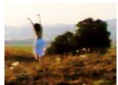
Nocturnes pour le roi de Rome de Jean-Charles Fitoussi, 2005