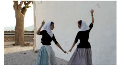
De la musique ou la Jota de Rosset de Jean-Charles Fitoussi, 2013