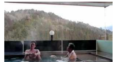
Temps japonais de Jean-Charles Fitoussi, 2008

Film précédé de Esprit pour les générations futures de Jean-Charles Fitoussi