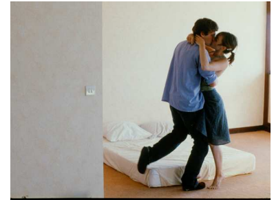
Je ne suis pas morte de Jean-Charles Fitoussi, 2008