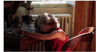
L'Enclos du temps de Jean-Charles Fitoussi, 2012