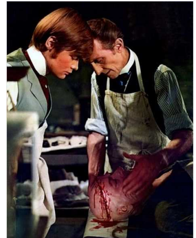
Le Retour de Frankenstein de Terence Fisher, 1968

Film précédé de Cavatine de Jean-Charles Fitoussi