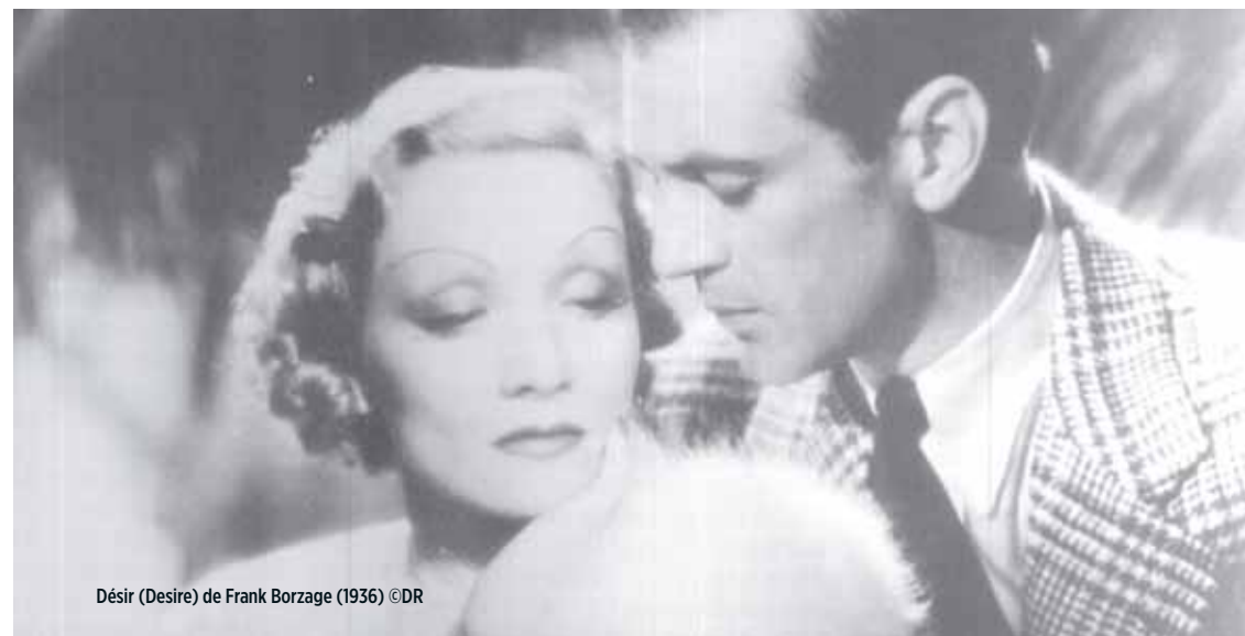
Désir (Desire) de Frank Borzage (1936)