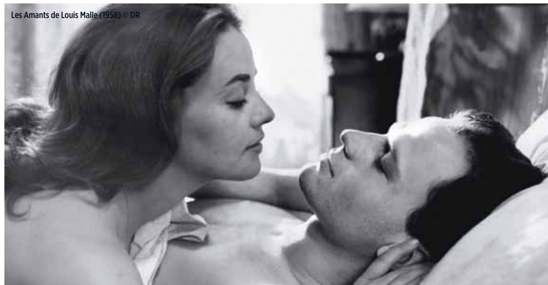
Les Amants de Louis Malle (1958)