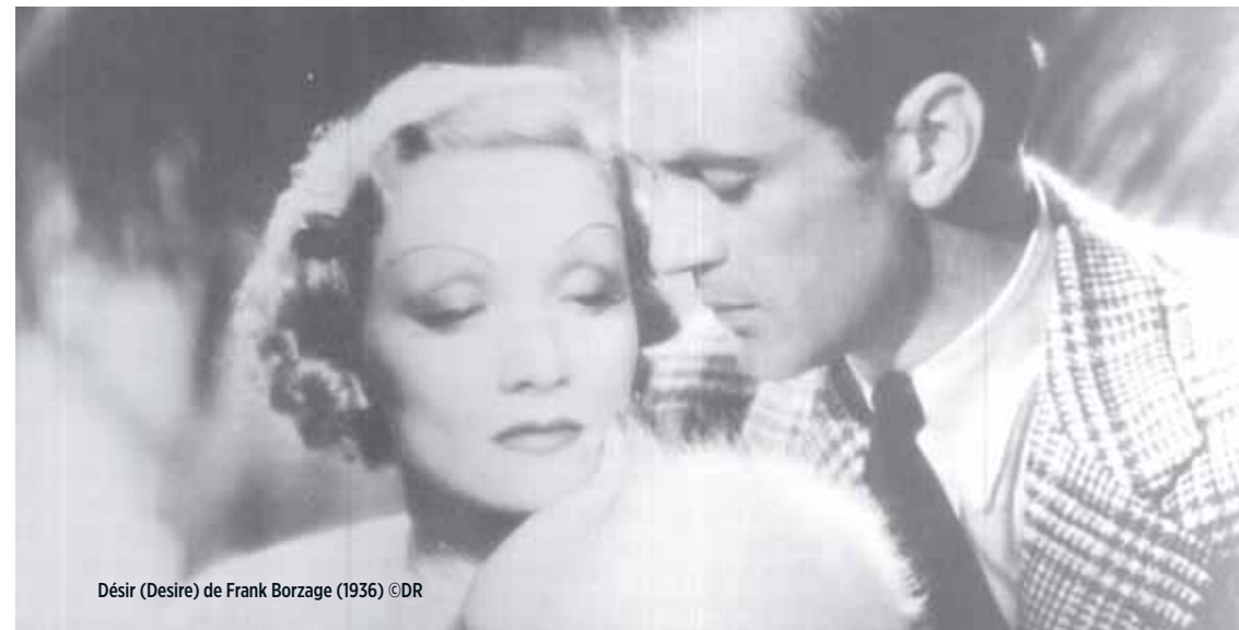
Désir (Desire) de Frank Borzage (1936)