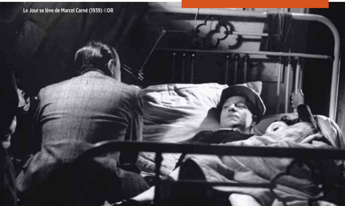
Le Jour se lève de Marcel Carné (1939)

En 1857, le Roi d'une province musulmane de l'Inde cède face à l'expansion coloniale de l'Angleterre. Mais même ce contexte politique agité ne saurait détourner Mir et Mirza, deux aristocrates indiens, de leur passion, le jeu d'échecs. Ici, Ray quitte le Bengale et pose sa caméra dans le royaume d'Avadh, région musulmane de l'Inde.