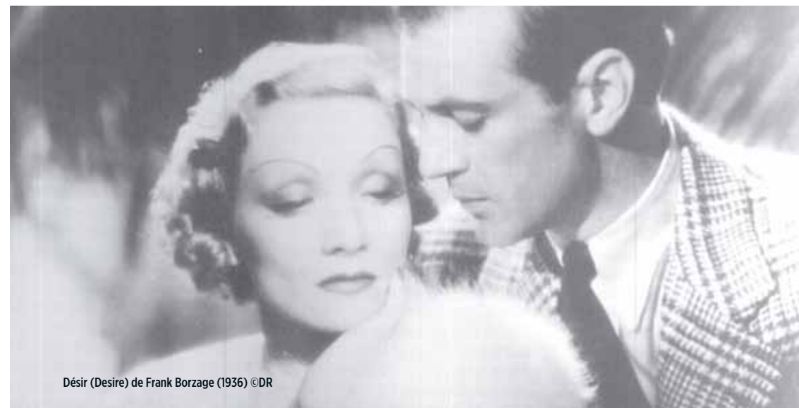
Désir (Desire) de Frank Borzage (1936)

Soirée présentée par Vincent Cotro, musicologue.