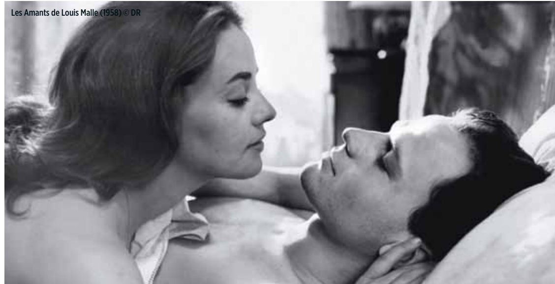
Les Amants de Louis Malle (1958)