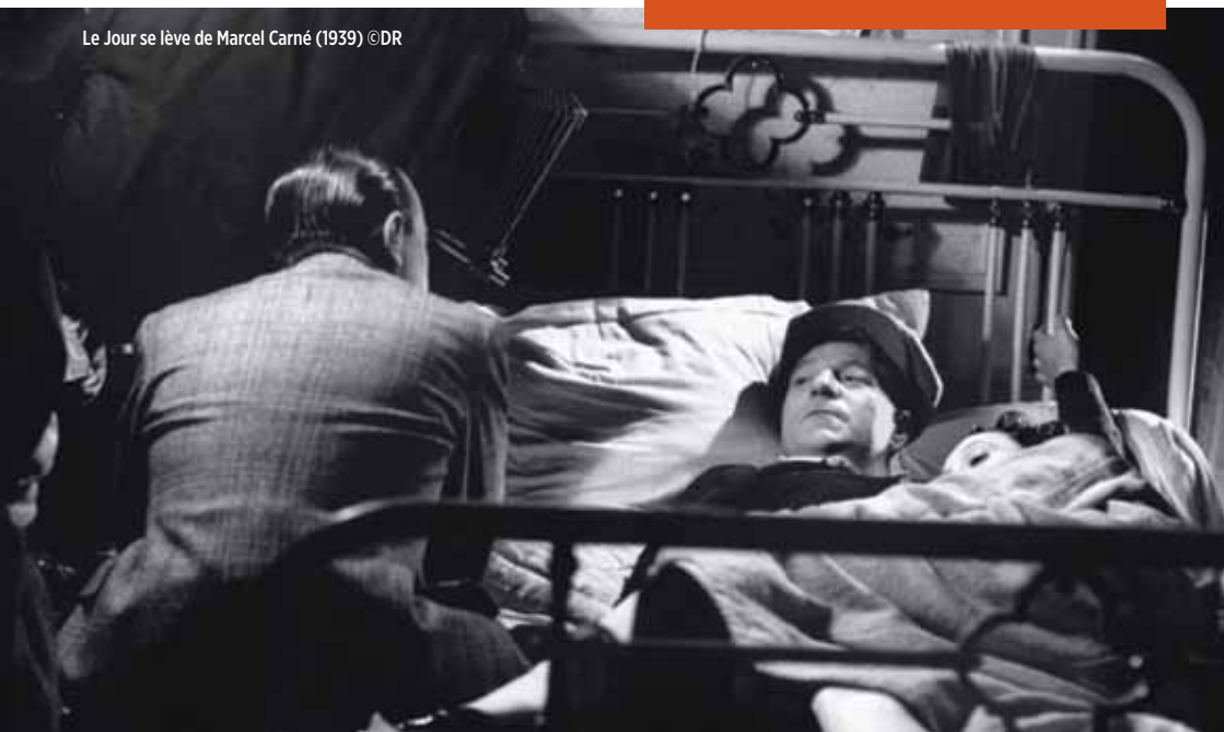
Le Jour se lève de Marcel Carné (1939)

En 1857, le Roi d'une province musulmane de l'Inde cède face à l'expansion coloniale de l'Angleterre. Mais même ce contexte politique agité ne saurait détourner Mir et Mirza, deux aristocrates indiens, de leur passion, le jeu d'échecs. Ici, Ray quitte le Bengale et pose sa caméra dans le royaume d'Avadh, région musulmane de l'Inde.