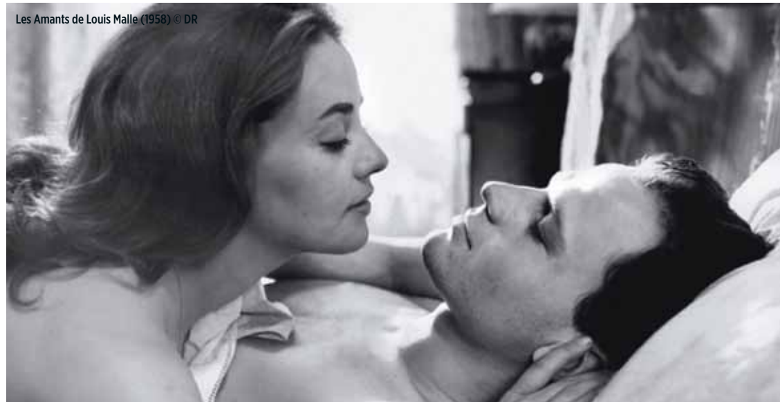
Les Amants de Louis Malle (1958)