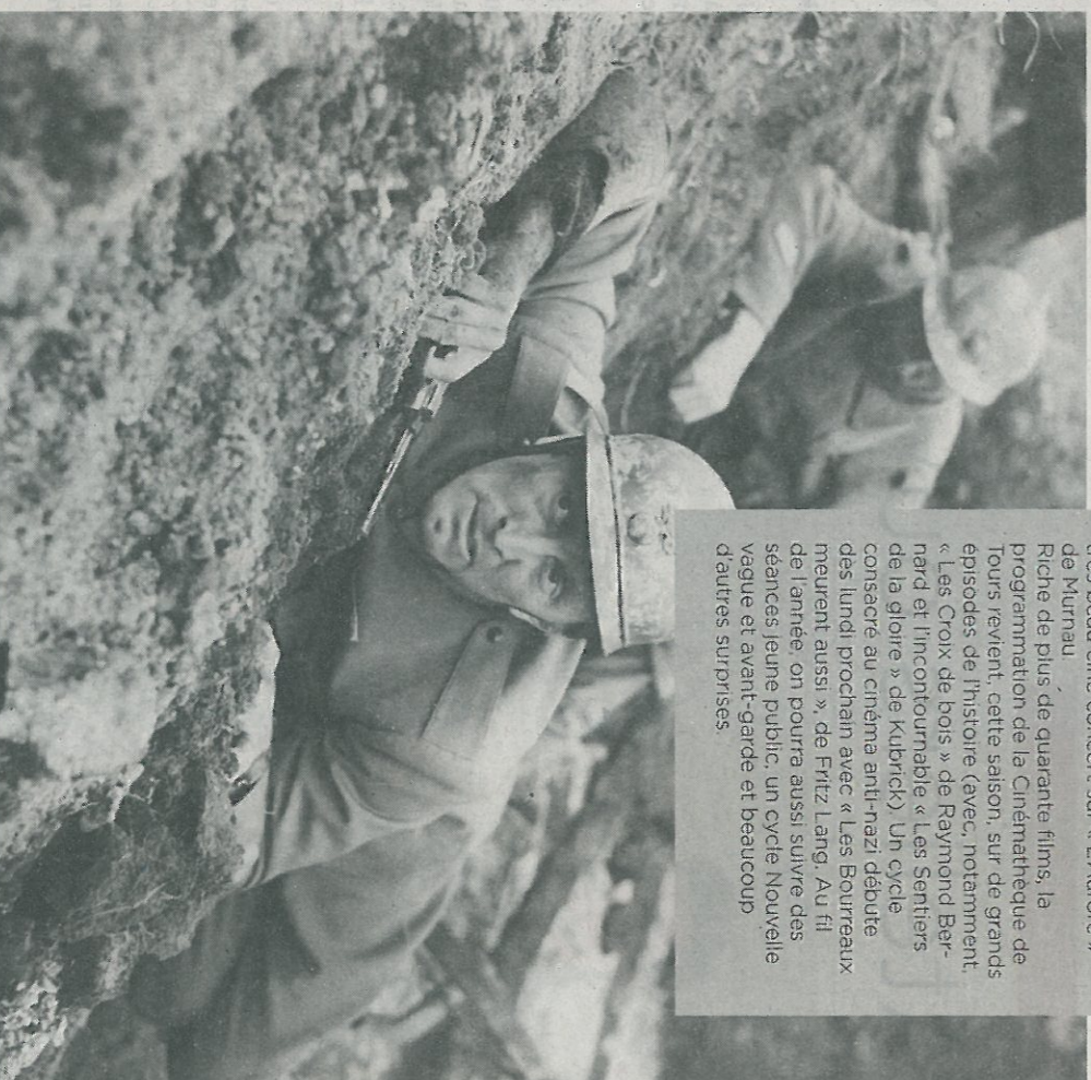
« Les Sentiers de la gloire », de Stanley Kubrick, le 9 novembre.