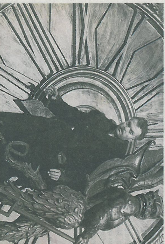
« Le Criminel », d'Orson Welles, le 19 octobre.

Programmation complète et informations pratiques sur www.cinematheque.tours.fr