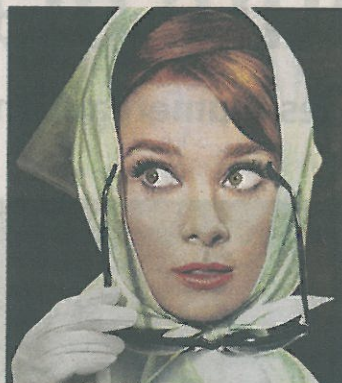
La formidable Audrey Hepburn dans « Charade ».

> Cycle « Mémoire de la cinémathèque de Tours » , en écho à l'exposition d'affiches « Quand la cinémathèque était au Beffroi », visible à la médiathèque François-Mitterrand. L'équipe programme des films dont les affiches ont été retrouvées : le 1 er mars, « L'Homme de l'Arizona » de Budd Boetticher (1957). Ou encore, le 29 mars, « Point Limite Zéro » de Richard Sarafia (1971), film de la Beat ge-